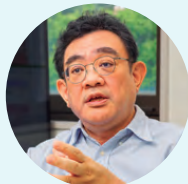
山中 康裕 北海道大学地球環境 科学研究所 教授