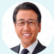
秋元 克広 札幌市長